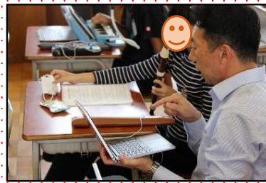
教師はピンポイントで支援