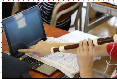
間違ったところに戻って練習